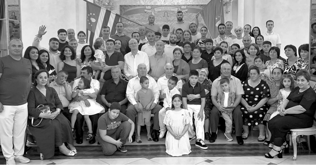
На семейном сборе Чаговых в Черкесске