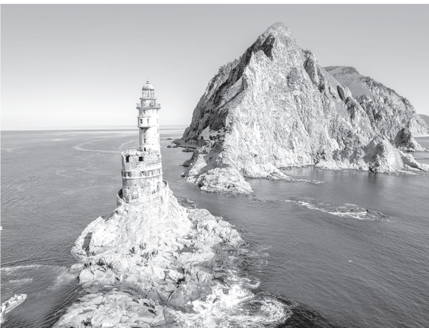
Виды Дальнего Востока не могут не восхищать

— Когда я была студенткой, мама рассказывала мне о своей поездке на Дальний Восток. Поскольку в то время не было таких хороших камер, как сейчас, она сделала снимок на старый пленочный фотоаппарат «Зенит», который, конечно, не